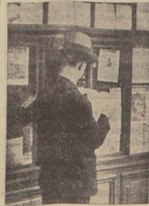
Bugün kütüphanelerimizin camekânları tercüme eserlerle doludur

Ankara, 16 (Hususi) — Öğrendiğime göre, Maarif Vekâleti son günlerde memleketin umumî ilim vaziyetini alâkadar eden çok mühim bir mesele ile meşgul olmaktadır. Bu mühim mesele, bir kısım ecnebi eserlerin Türkçeye tercüme edilmesinde yeni çıkan müşkül bir vaziyetten ibarettir. Malûmdur ki bir kısım muharrirler ve ilim adamları ecnebi lisanlarla basılmış romanları ve ilim kitaplarını Türkçeye tercüme ettikleri zaman bunların Avrupadaki nâşirlerine telif hakkı vermemektedirler. Fakat Almanya ve Fransa