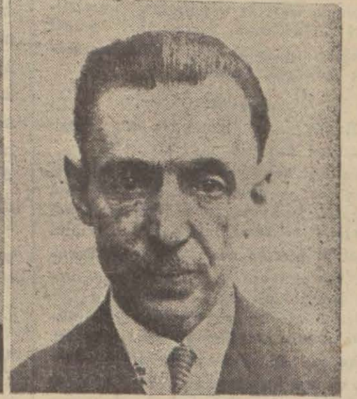
Birbirlerine muhalif fikir beyan eden