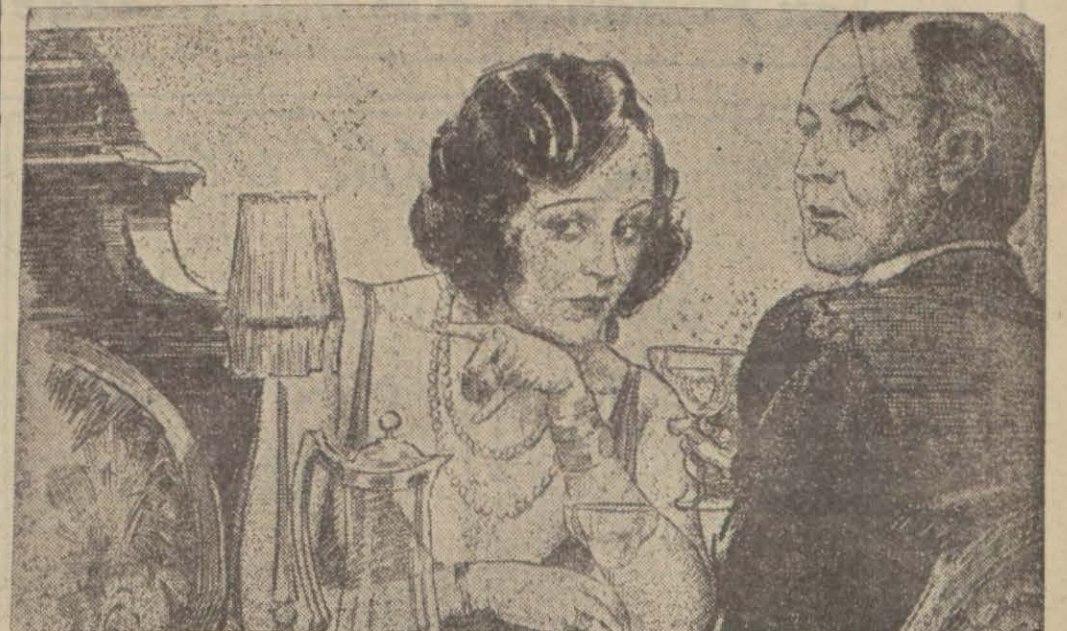
(Yazısını 9 uncu sayfamızda bulacaksınız)